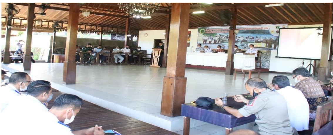
Rapat Forum LLAJ di Kab. Pesisir Selatan