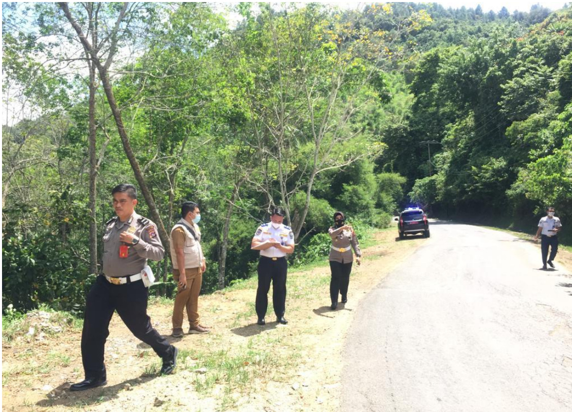
Gambar II. 4 Survey Inventarisasi Daerah Laka di Kab. Tanah Datar

Pelaksanaan survey dengan instansi-intansi terkait untuk penanggulangan lokasi daerah rawan kecelakaan di Provinsi Sumatera Barat. Hal ini sebagai tindaklanjutan data Daerah Rawan Kecelakaan yang telah dihimpun dan dianalisis dari tahun 2020 s.d. 2021. Pada tahun 2022 akan dilanjutkan dengan pengecekan lapangan dan survey pada lokasi rawan kecelakaan dan menganalisis apa kebutuhan penanganan yang dapat dilakukan oleh masing-masing pemangku kepentingan. Dalam hal ini terutama pada pihak Kepolisian, Dinas Bina Marga Cipta Karya dan Tata Ruang dan Dinas Perhubungan yang bersinergi dengan instansi terkait lainnya.