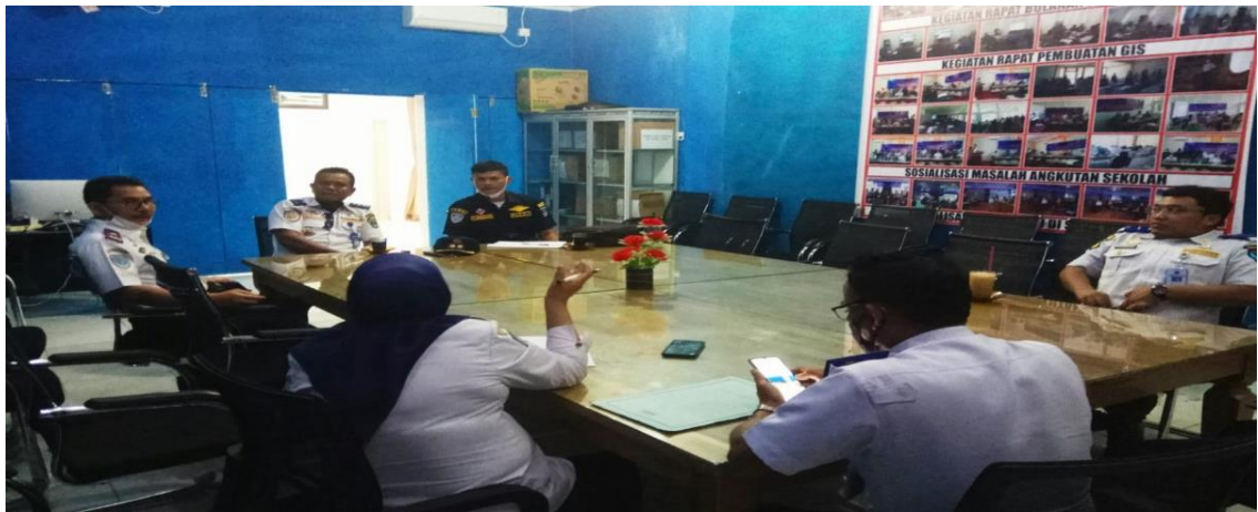
Koordinasi Rapat FFLAJ

Pelaksanaan Rapat FLLAJ Prov. Sumatera Barat telah terlaksana dengan baik dari tahun 2020 dan tahun 2021. Dalam rapat tersebut para stakeholder memaparkan apa saja data lalu lintas yang telah dihimpun sesuai tupoksi masing-masing instansi. Peserta rapat yang hadir terdiri dari unsur masyarakat, pelaku usaha angkutan, akademisi perguruan tinggi, tokoh agama, pemerhati transportasi dan angkutan, mahasiswa, komunitas pengendara dan lain-lain. Usul, saran, dan masukan yang disampaikan saat rapat menjadi bahan evaluasi bagi masing-masing instansi terkait untuk memperbaiki dan meningkatkan peran sertanya dalam penyelenggaraan transportasi jalan yang aman dan berkeselamatan. Dan pada tahun 2022 direncanakan rapat koordinasi akan dilaksanakan dengan lebih terfokus pada materi-materi dan permasalahan yang dihadapi secara teknis dan terperinci di Kabupaten/Kota se Sumatera Barat. Hal ini sebagai tindak lanjut dari rapat-rapat di tahun sebelumnya untuk merumuskan aksi nyata dalam mengimplementasikan keputusan-keputusan yang dihasilkan dalam rapat koordinasi FLLAJ.