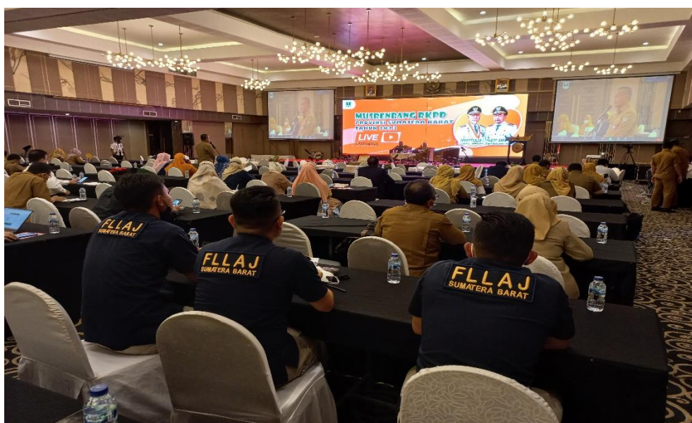
Gambar 2.7 : FLLAJ Aktif Berperan Mengikuti Musrenbang RKPD Tahun 2022

Ikut serta dalam Musyawarah Perencanaan Pembangunan Rencana Kerja Pemerintah Daerah (Musrenbang RKPD) Tahun 2023 dan menyampaikan masukan dan usulan terkait penyelenggaraan di bidang lalu lintas dan angkutan jalan berdasarkan aspirasi masyarakat yang tertampung dalam kegiatan FLLAJ, usulan-usulan yang disampaikan bertujuan untuk meningkatkan pelayanan terhadap masyarakat dalam penyelenggaraan lalu lintas untuk mewujudkan visi FLLAJ yaitu menyelenggarakan lalu lintas yang aman, selamat, tertib, mudah dan murah.