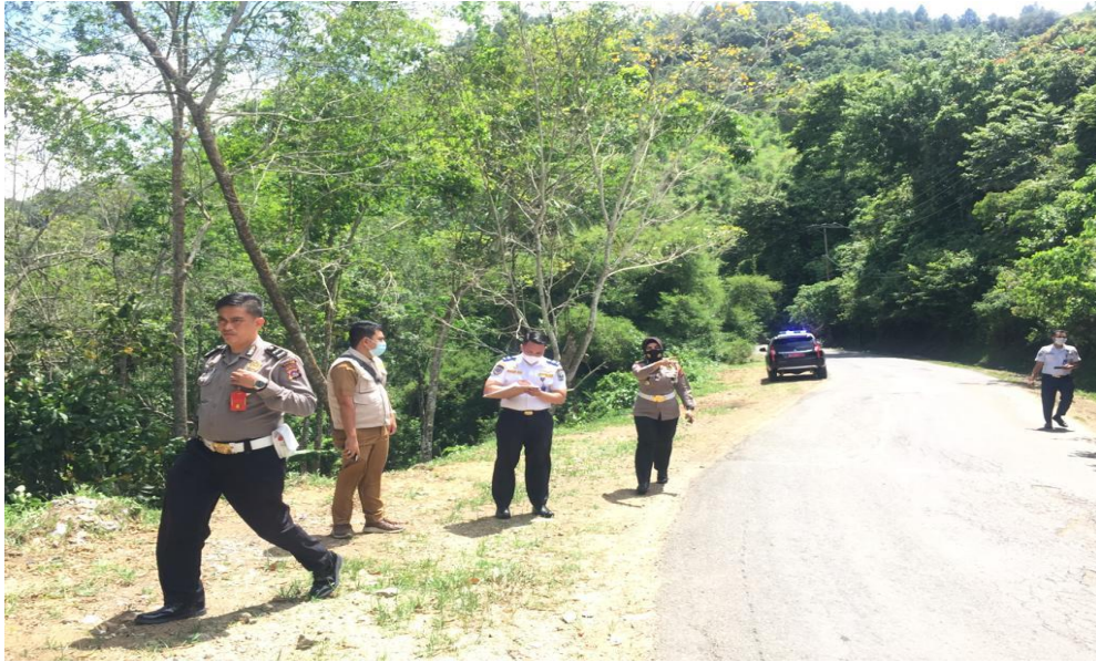
Gambar 2.6 : Mengusulkan Penanganan Blackspot Pada Musrenbang RKPD Tahun 2022