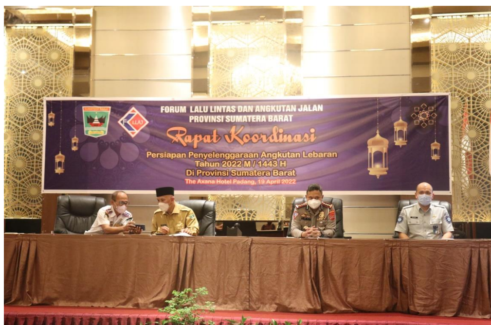
Gambar 2.4 : Rapat FLLAJ Dalam Rangka Penanganan Angkutan ODOL