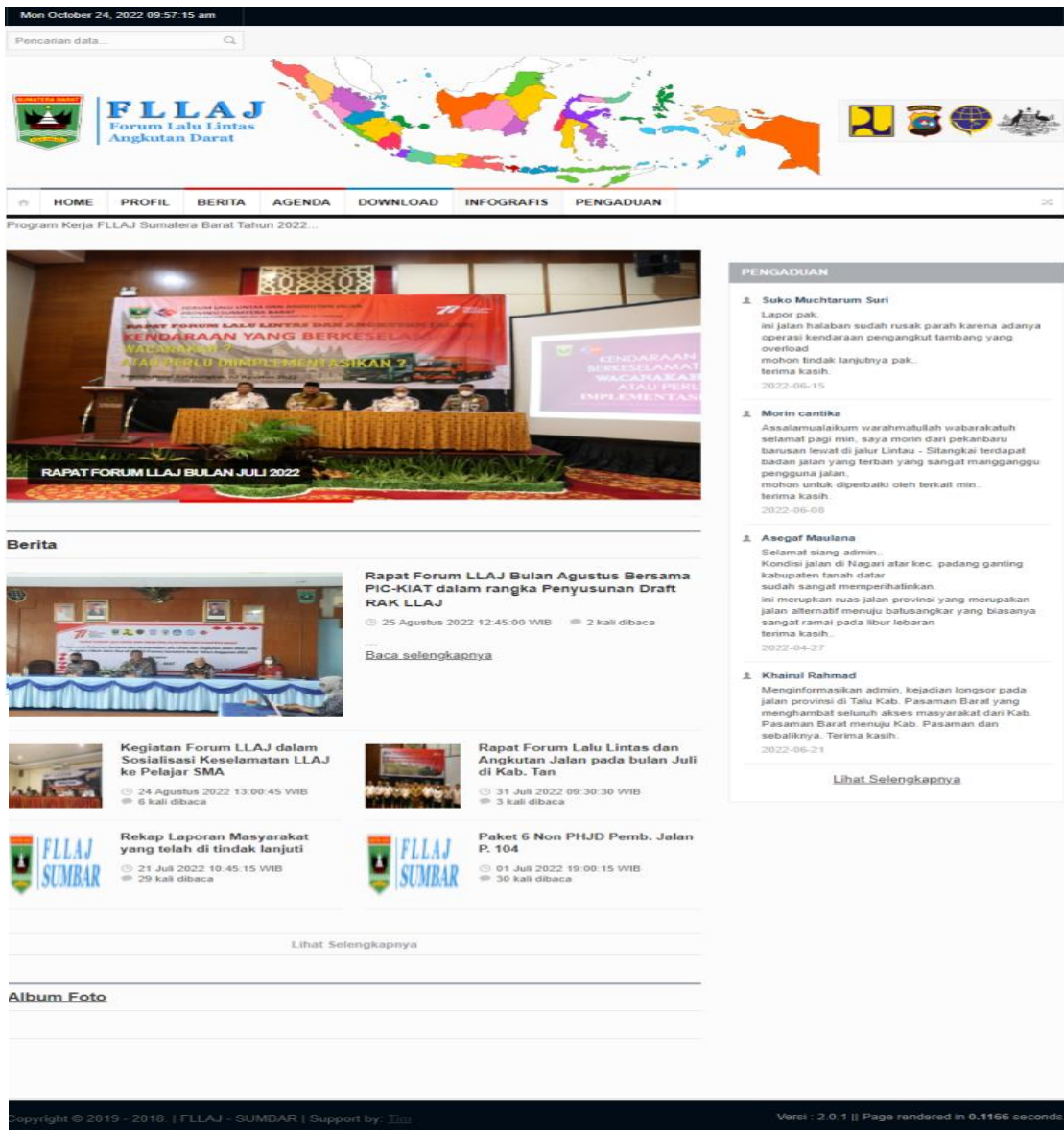
Gambar 2.2 : Tampilan Form Pengaduan Masyarakat