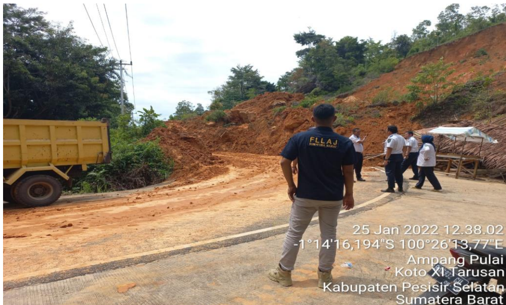
Gambar 2.8 : Menindaklanjuti Aduan Masyarakat Pada Saat Terjadi Longsor